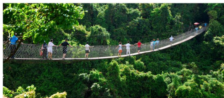
热带天堂森林公园4A-穿梭热带雨林，登高揽山海美景