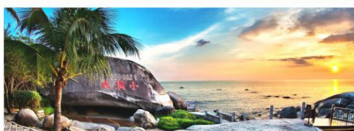
大小洞天5A-道家文化旅游圣地