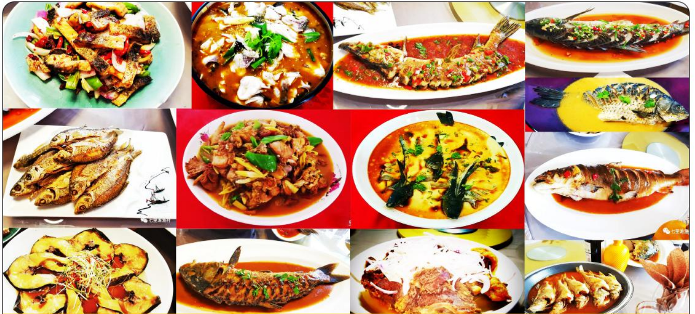
新疆阿勒泰特色冷水鱼宴