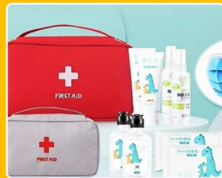
随车配备防疫大礼包