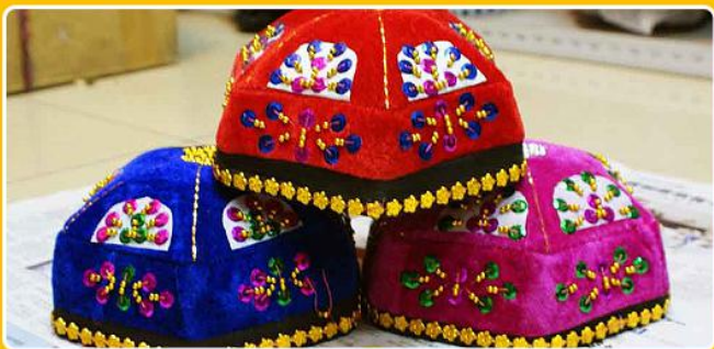
男士“艾德莱”民族花帽