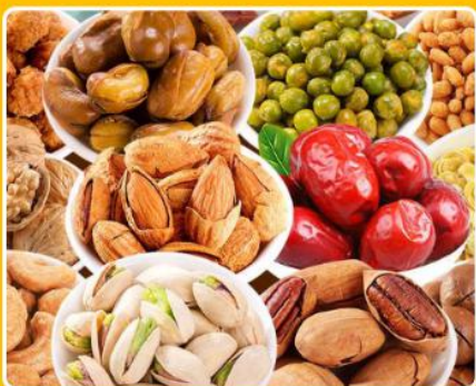
特色干果零食小礼包