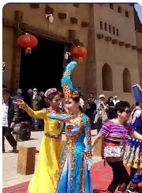
吐鲁番歌舞欢迎仪式