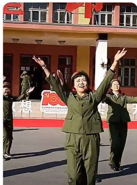
戈壁印象欢迎仪式 穿军装、唱红歌