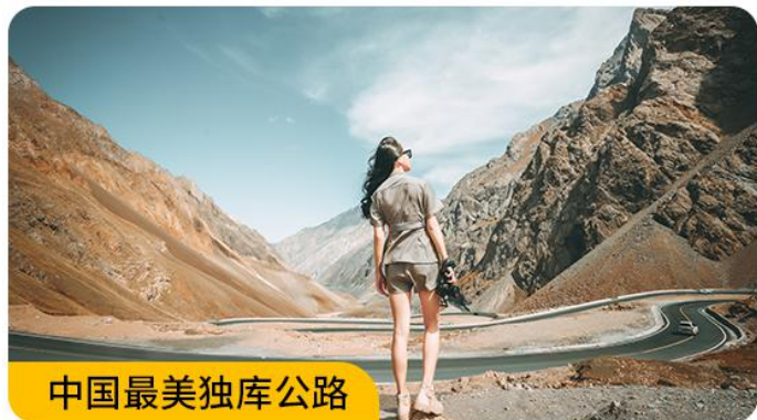
中国最美独库公路