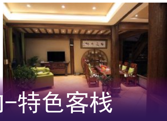
丽江古城内-特色客栈