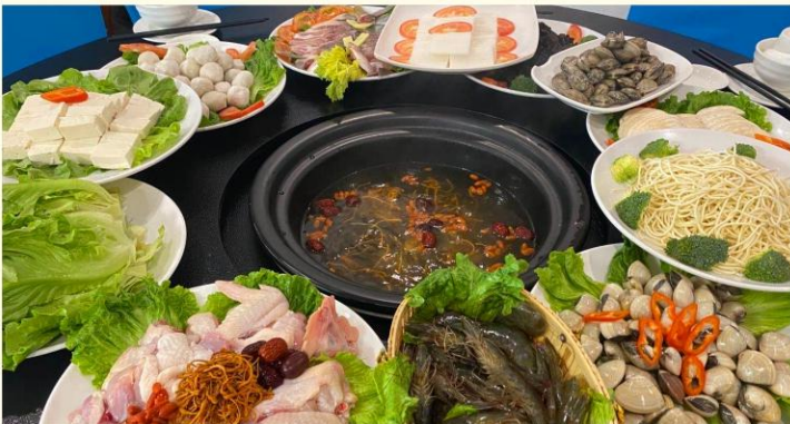
◆ 蛋家蒸汽海鲜火锅