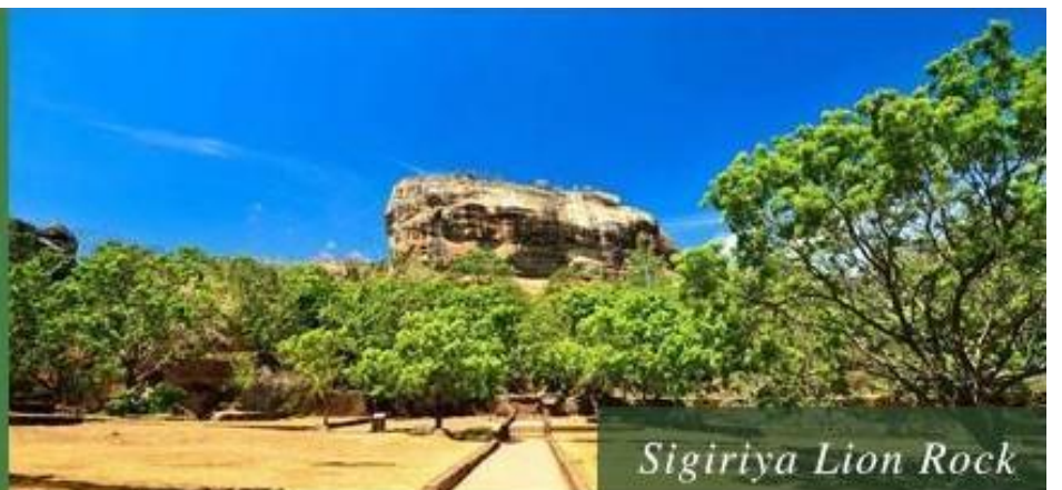
Sigiriya Lion Rock

狮子岩是在斯里兰卡锡吉里耶城的一座真真实实构筑在橘红色巨岩上的空中宫殿，有着澳洲艾尔斯岩的自然奇景。