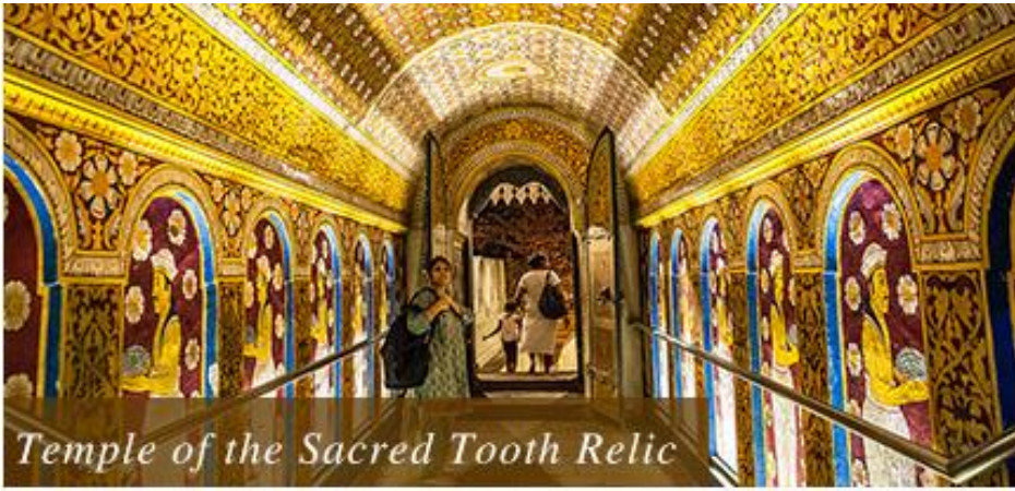
Temple of the Sacred Tooth Relic