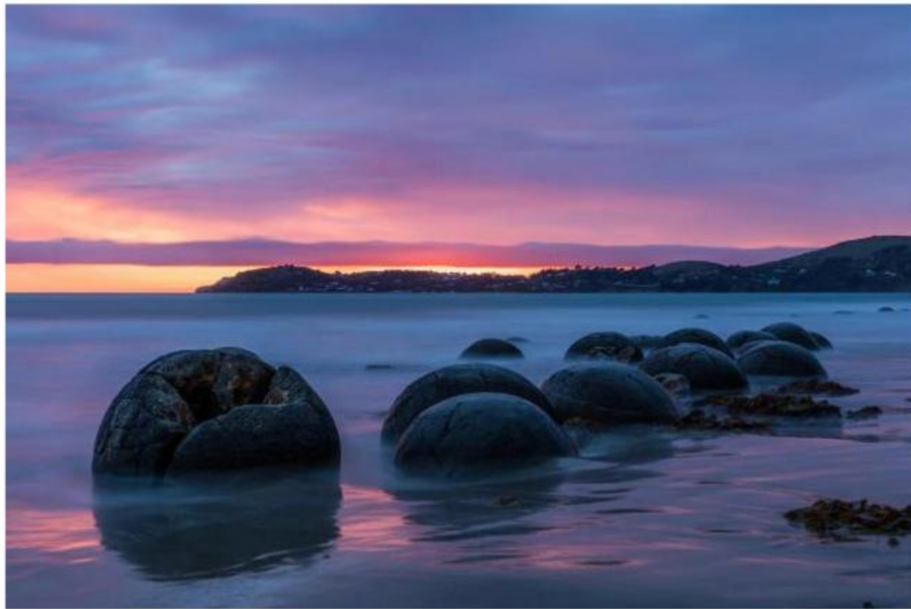
摩拉基大圆石 海滩