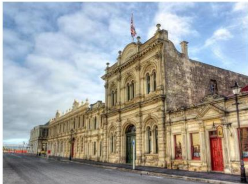
维多利亚历史遗迹区