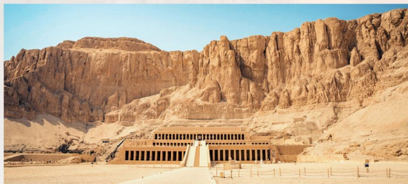
哈特谢普苏特女王神殿

IT IS THE MOST IMPORTANT TEMPLE IN THEBES MIDDLE KINGDOM AND NEW KINGDOM LAW IN ANCIENT EGYPT THE SACRIFICIAL PLACE OF THE OLD GATE