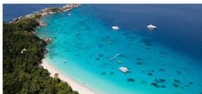
8号岛登岛俯瞰爱情峡湾

The Similan Archipelago is home to some of the world's most beautiful, unspoiled islands With an abundance of diverse Marine life and spectacular coral reefs