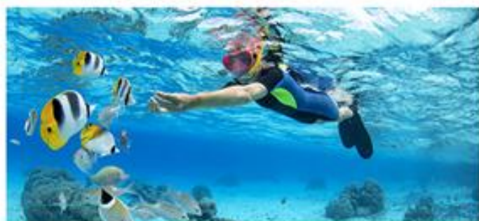
9号岛游泳浮潜与鱼共舞