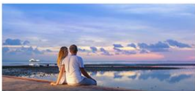
4号岛登岛漫步蜜月沙滩