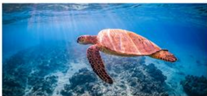
7号岛游泳浮潜寻觅海龟