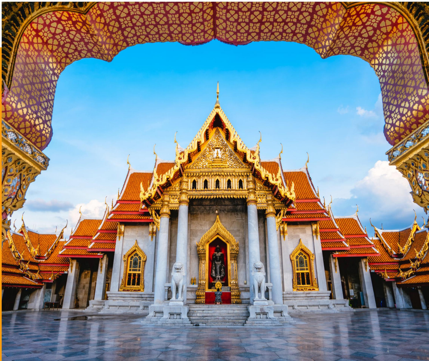
富丽堂皇的大皇宫

EXPERIENCE THE CHANGE OF THAI CULTURE THROUGH ARCHITECTURAL HISTORY AND LOCAL CUSTOMS AND HUMANITIES