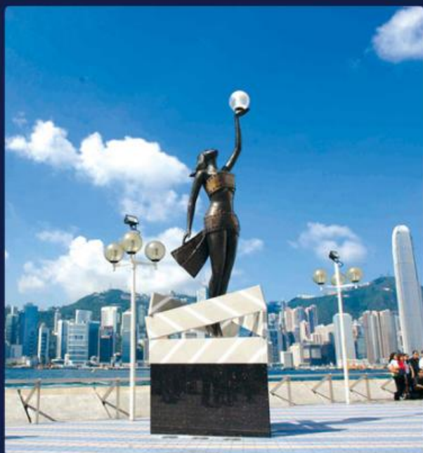
天星小轮/星光大道/1881前水警总部