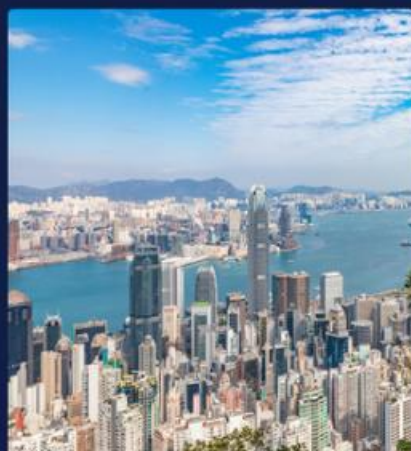
金紫荆广场/香港大馆 太平山顶