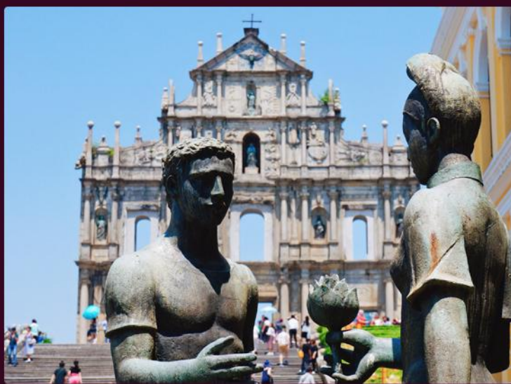
大三巴 / 炮台山 / 恋爱巷