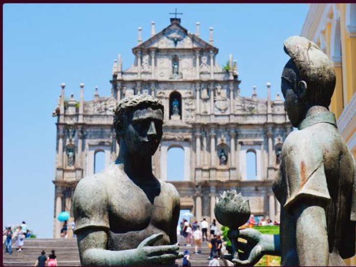
大三巴 / 金莲花广场 / 渔人码头