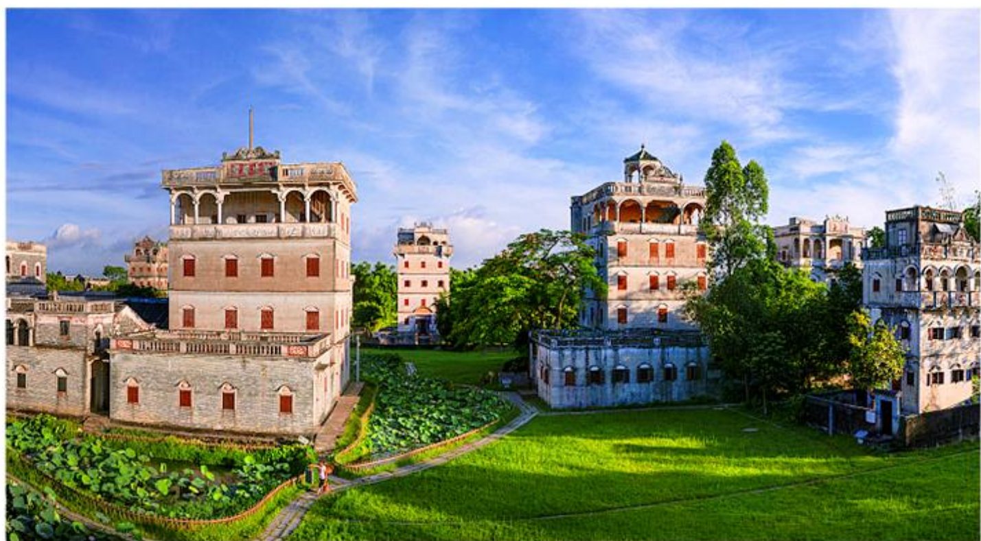
开平碉楼 赤坎古镇：广袤的田园风光与典雅的洋楼建筑相映成趣