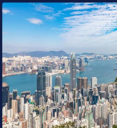
金紫荆广场/香港大馆 太平山顶