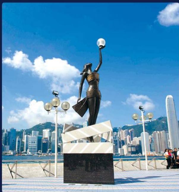
黄大仙/星光大道/1881前水警总部