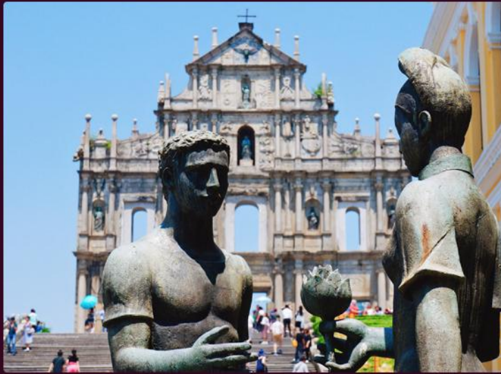
大三巴 / 炮台山 / 恋爱巷