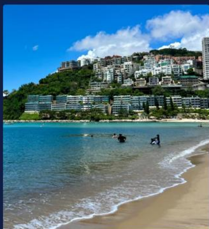
太平山 / 浅水湾 维多利亚港