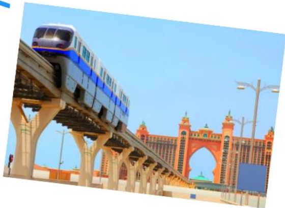
Palm Jumeirah Monorail

是当今阿联酋内阁和阿联酋高权力机构联邦高委员会的官方会议场所，也是正式国事访问和各国首脑活动的举办地。