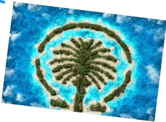
Palm Island 棕榈岛!