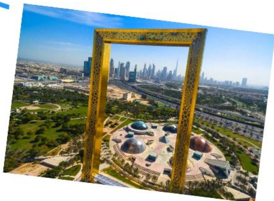
The Dubai frame 迪拜之框!