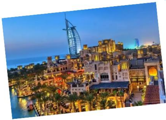
Souk Madinat Jumeira 古堡运河集市!