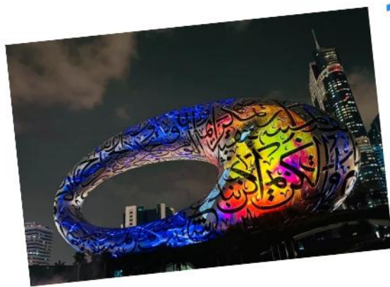
Museum of the Future 未来博物馆!