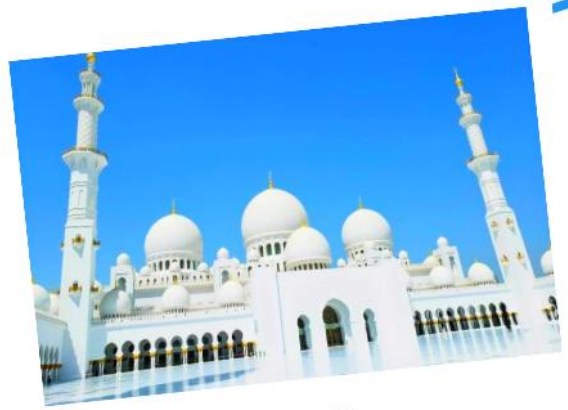
Sheikh Zayed Grand Mosque