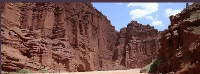
天山托木尔大峡谷