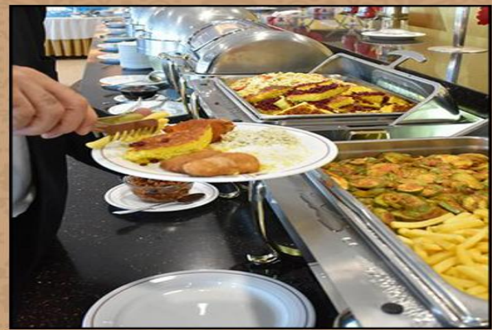
五星酒店自助早餐 هفوب لته