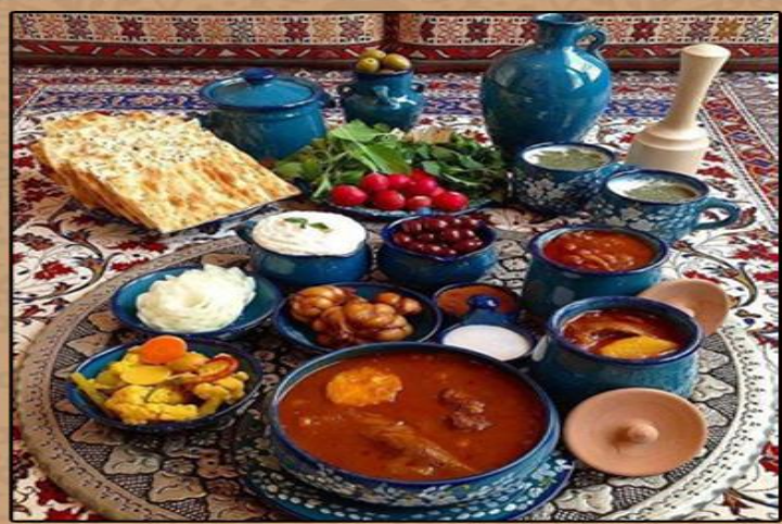
伊朗特色美食 کناریا یادغ سکع