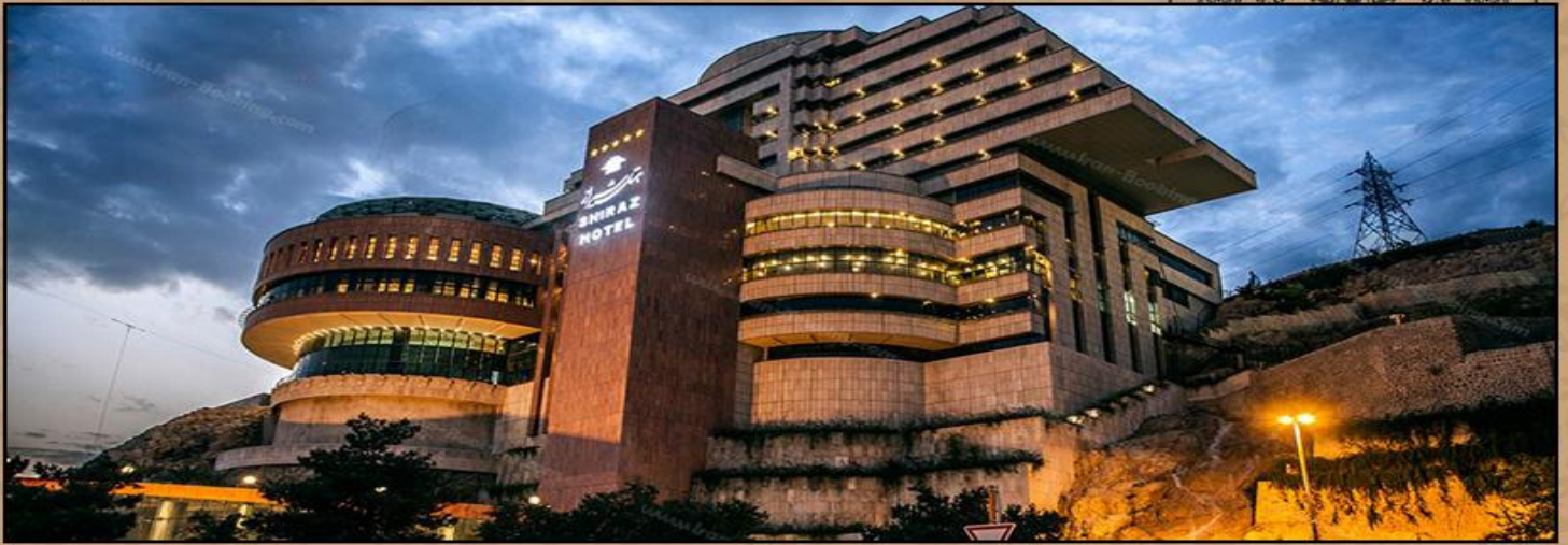
设拉子查姆兰酒店 CHAMRAN SHIRAZ HOTEL