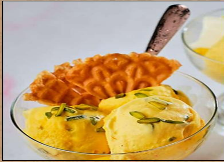
藏红花冰淇淋 کنت سرب نارفعز