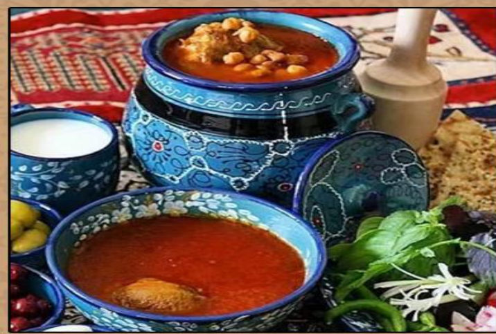
瓦罐羊肉餐 تشوگ کاج