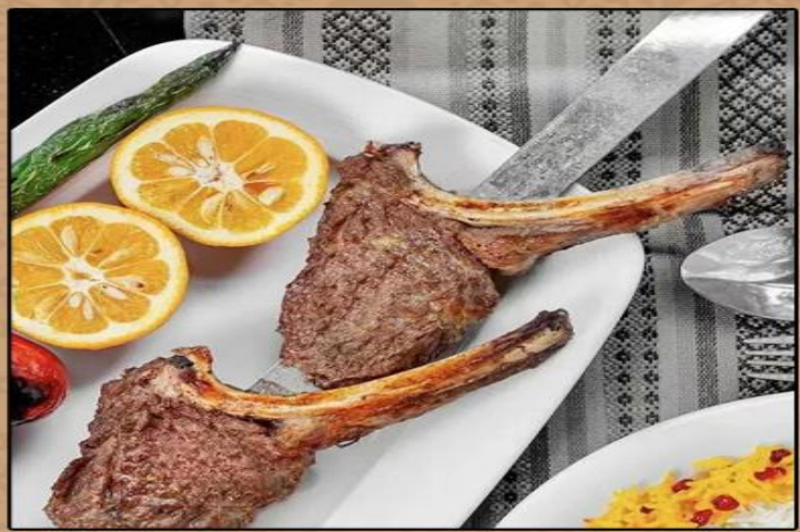
波斯羊排餐 دنفسوگ تشوگ