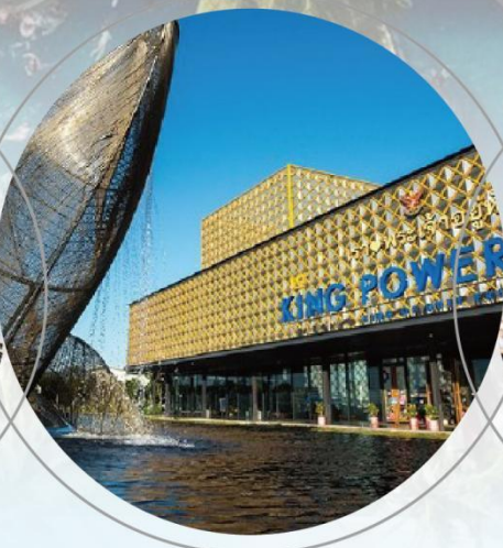
King power 皇权免税店