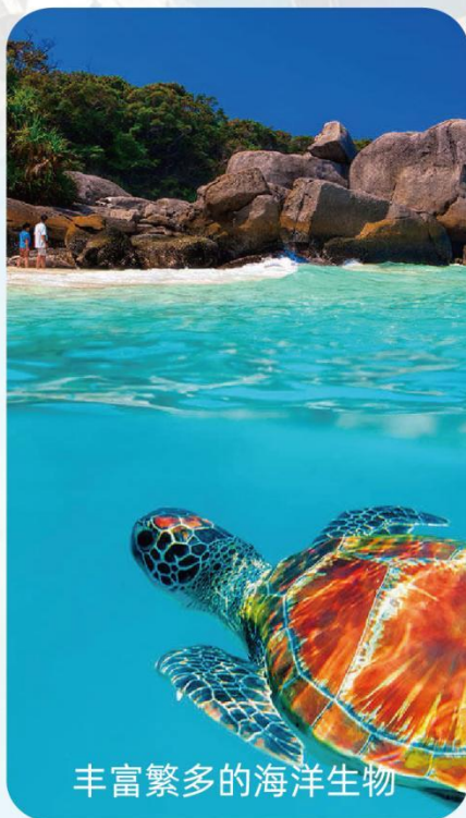
丰富繁多的海洋生物