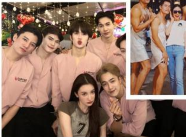
曼谷最火猛男海鲜餐厅 STANEEMEEHOI