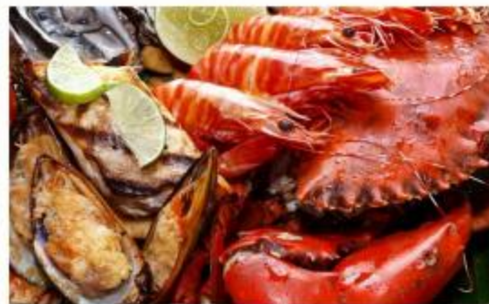
中天海滩大螃蟹餐厅： 自由行客人必打卡的热门餐厅，鲜活 大螃蟹口味一流