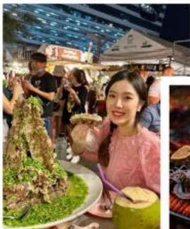
兰坡海鲜市场： 背包客钟爱的海鲜自由市场， 现买现加工，种类繁多且新鲜