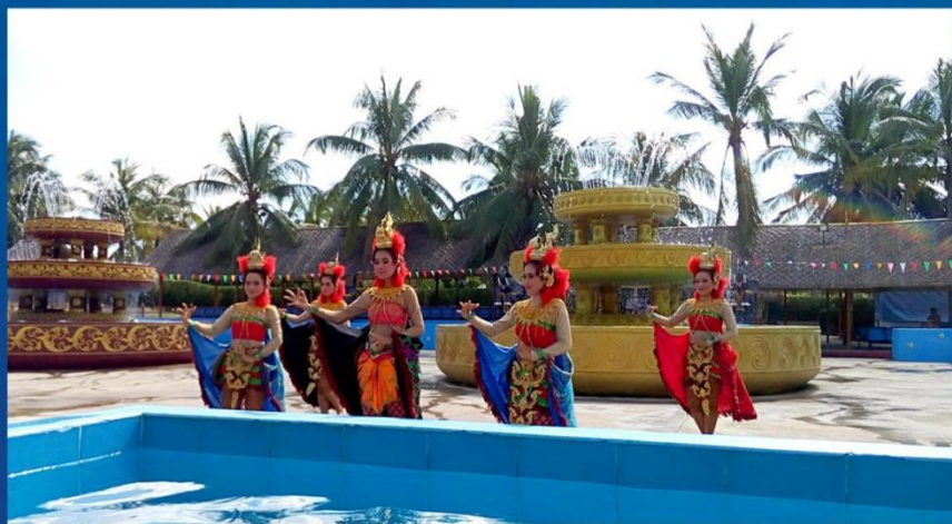
② 泰国风情园全套体验