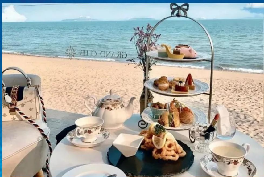
⑥ Garden Cliff 海边下午茶