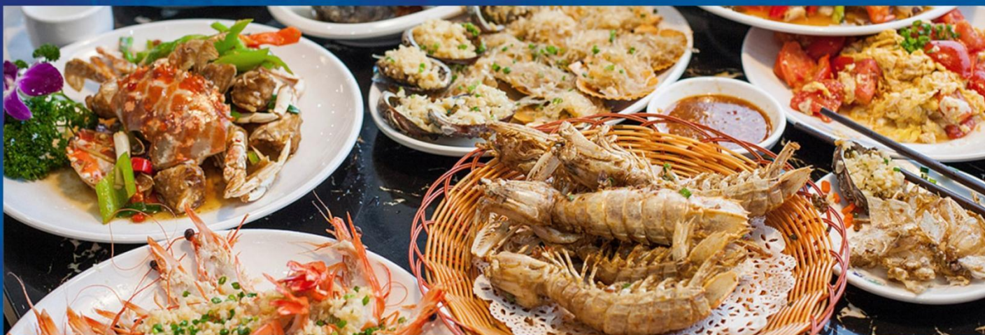
沙美岛海鲜风味餐