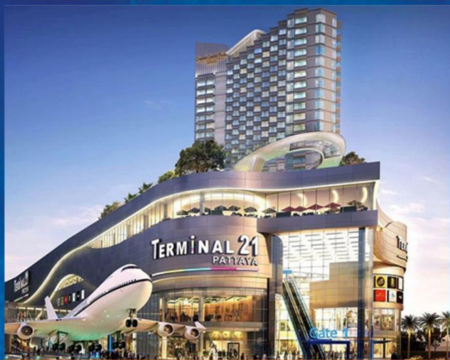
④ 网红terminal21航站楼 扫荡当地本土品牌