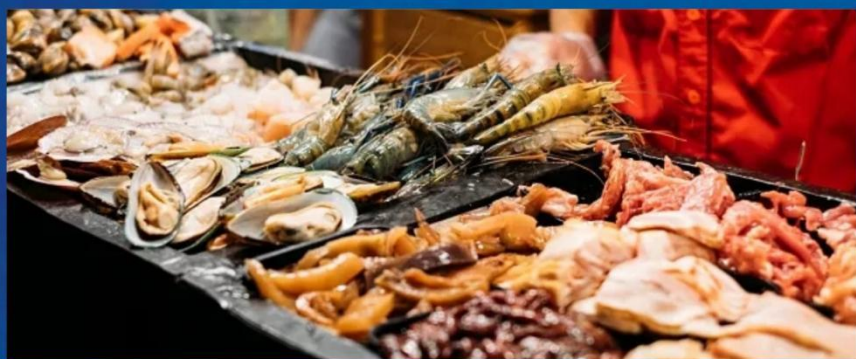
③ 兰坡海鲜市场，现买现吃海鲜自由