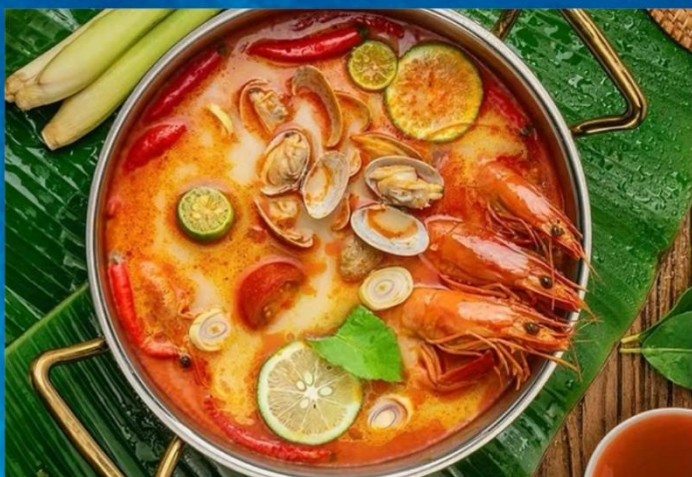
泰式小火锅&泰式风味餐