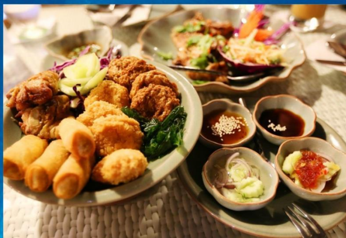
夜市文化——自由选择品尝地摊美食