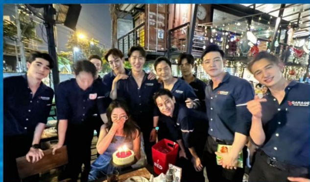
⑤ 养眼派对—— 曼谷夜市+76号男模餐厅打卡