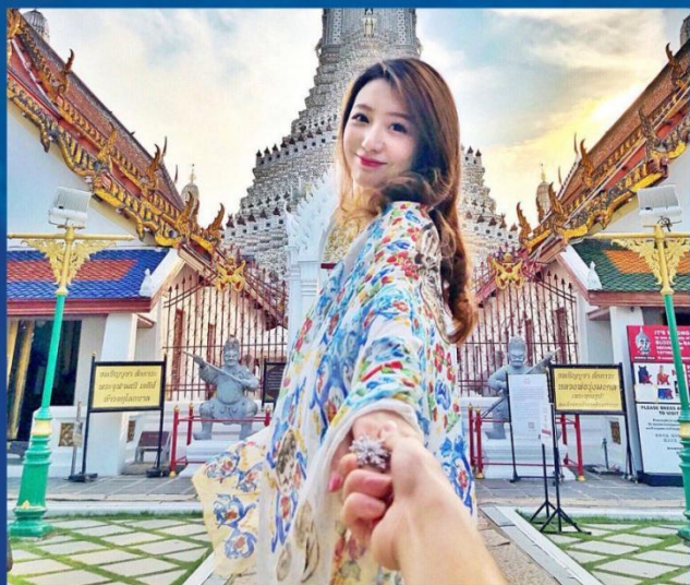
① 泰国地标名片，世界著名IP 大皇宫 / 玉佛寺