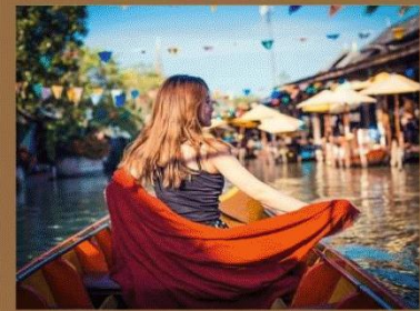
丹嫩沙朵水上市场