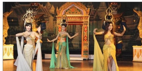
人妖表演 ——泰式特有风采