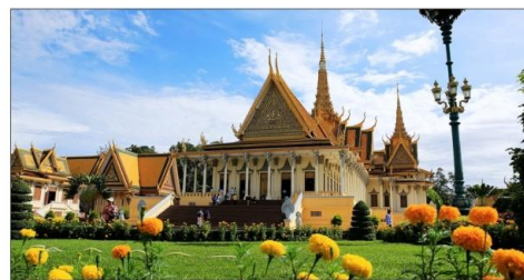
大皇宫 ——泰国的经典地标