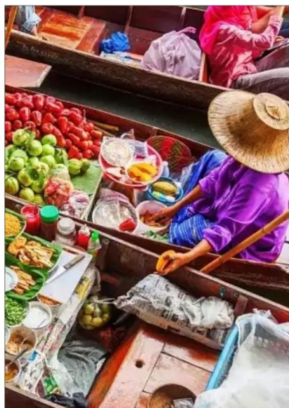
杜拉拉水上市场 ——泰式平凡的烟火气