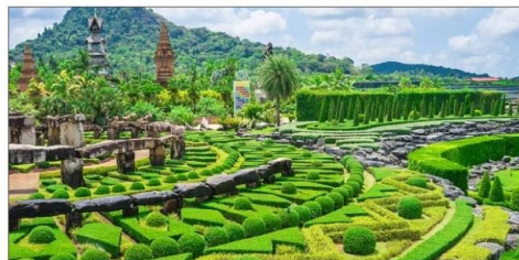
东芭乐园 ——泰式民俗自然园区