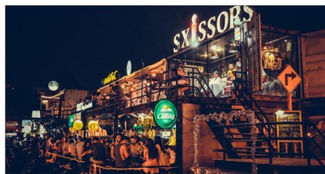
网红亚洲或火车夜市 ——爆款红人打卡地