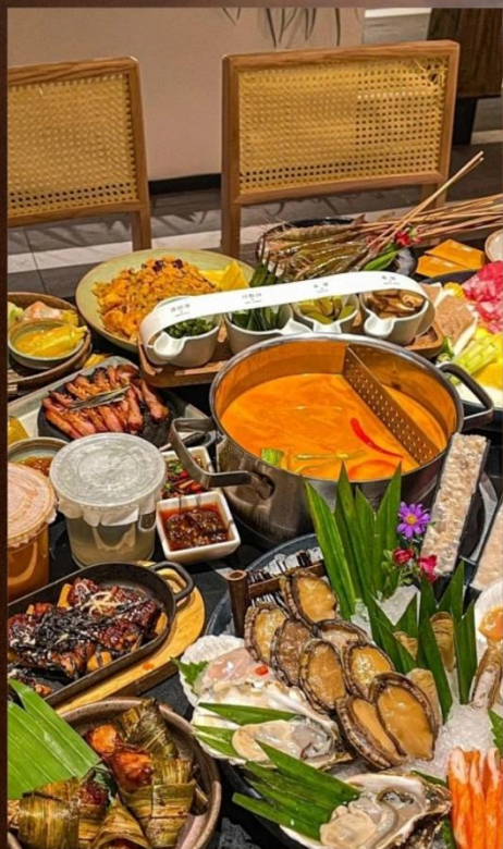
异国美食 特别安排泰式烧烤火锅自助