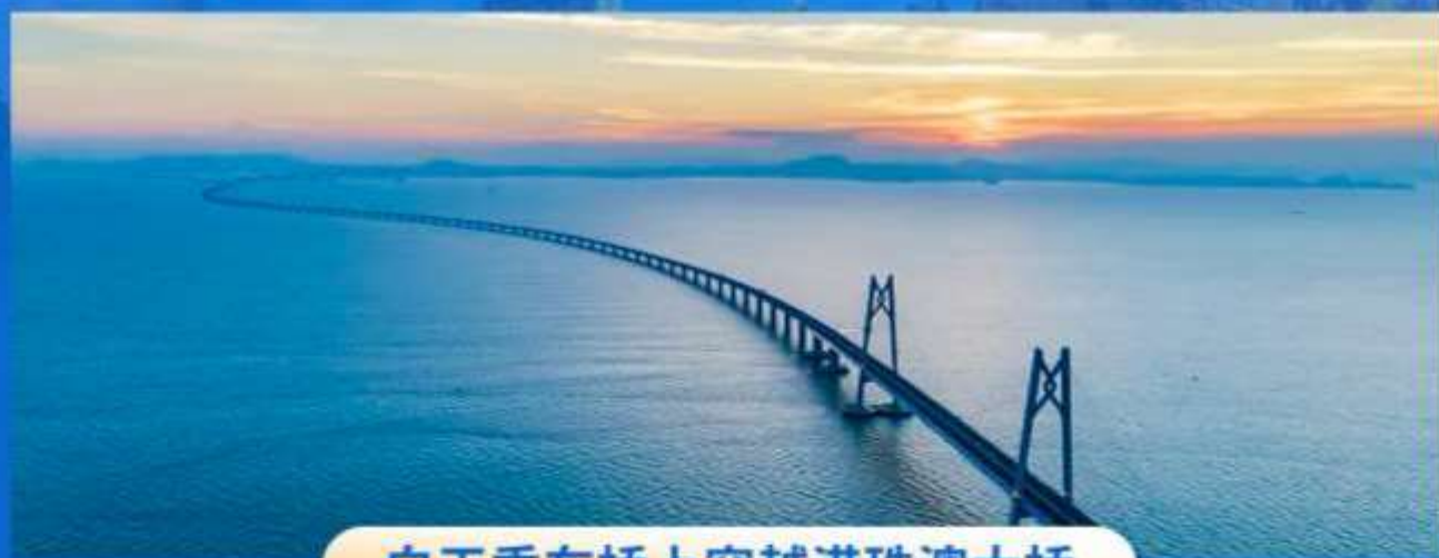
白天乘车桥上穿越港珠澳大桥