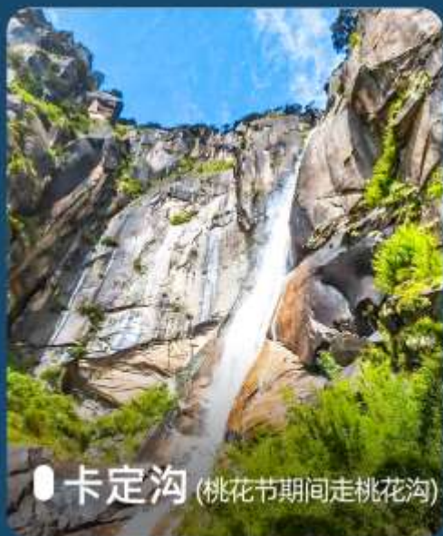
● 卡定沟 (桃花节期间走桃花沟)