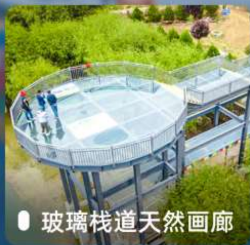
● 玻璃栈道天然画廊