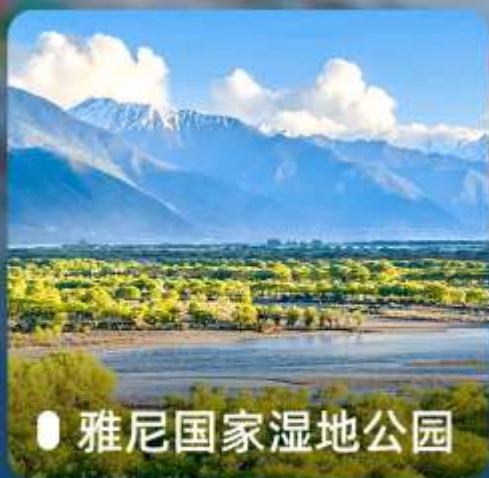
● 雅尼国家湿地公园