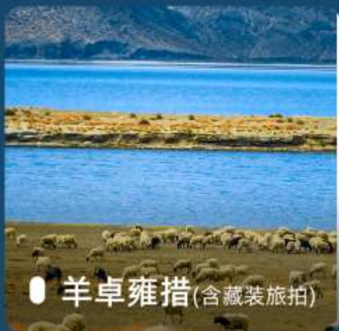
● 羊卓雍措(含藏装旅拍)