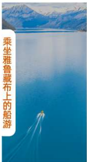
乘坐雅鲁藏布上的船游