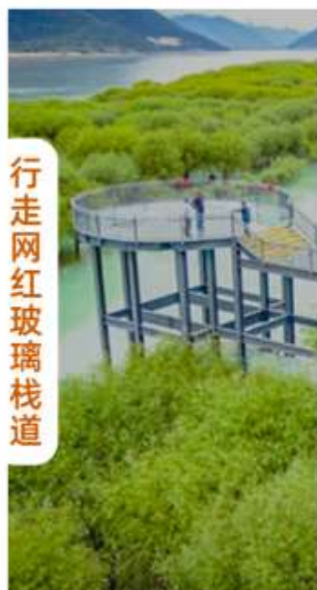
行走网红玻璃栈道