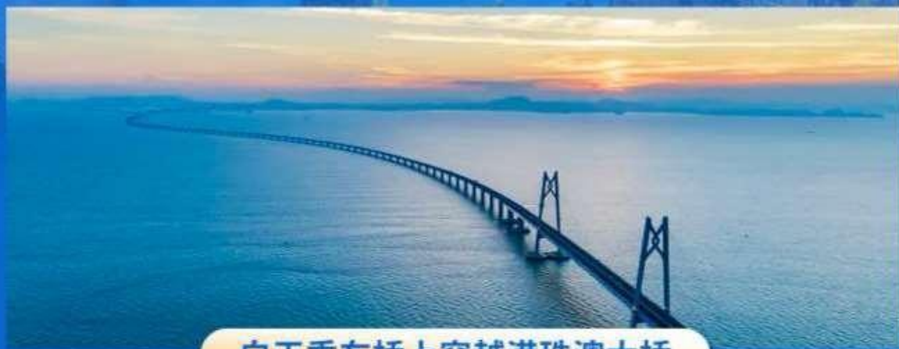
白天乘车桥上穿越港珠澳大桥