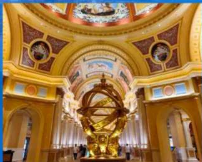
澳门威尼斯人度假酒店