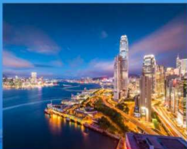
香港夜游维多利亚港