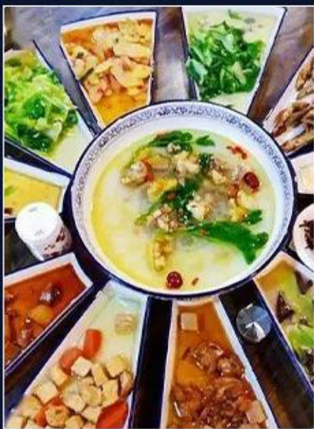
黄果树花开富贵宴