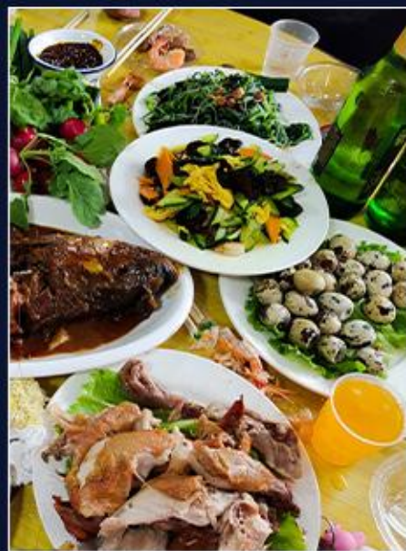
百里杜鹃特色农家宴