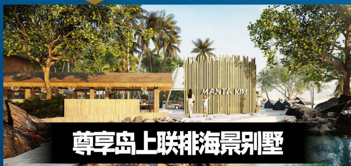
尊享岛上联排海景别墅