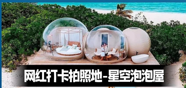
网红打卡拍照地-星空泡泡屋