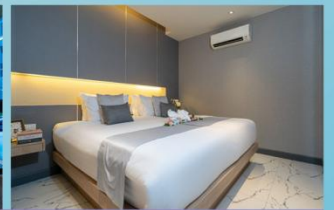
芭东湾公寓 Patong Bay Residence