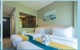
普吉岛卡娜三L酒店 Kana Triple L Hotel Phuket