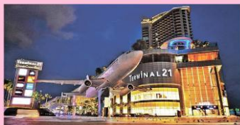
芭提雅之最21号航站楼