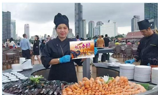
皇家公主号海鲜自助餐