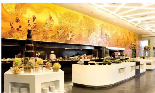
King Power 国际自助餐