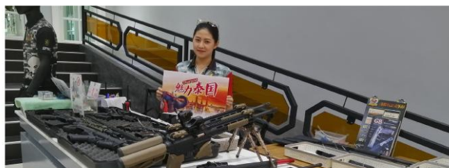
真枪打靶（每人5发子弹）