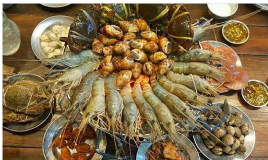
大头虾海鲜 BBQ 任吃