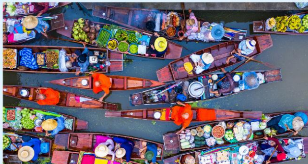
丹嫩沙朵搭搭手摇船