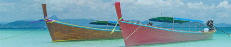
📍 沙美岛 ShaMei Dao