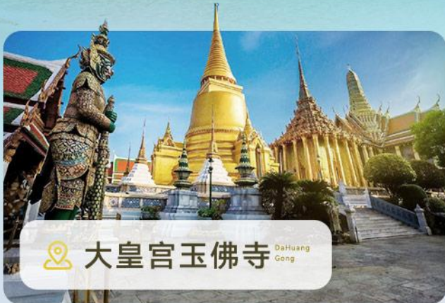
📍 大皇宫玉佛寺 DaHuang Gong