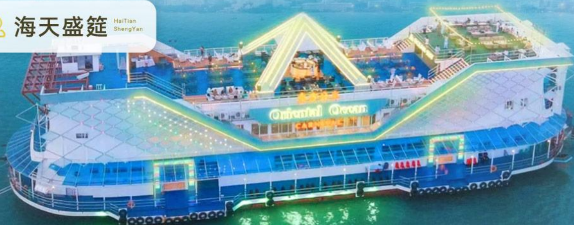
📍 海天盛筵 HaiTian ShengYan