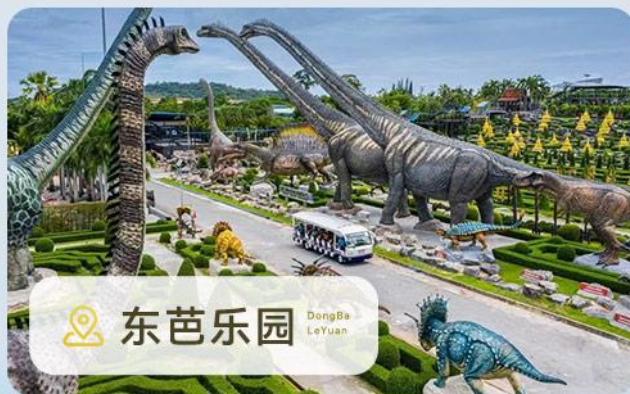
📍 东芭乐园 DongBa LeYuan