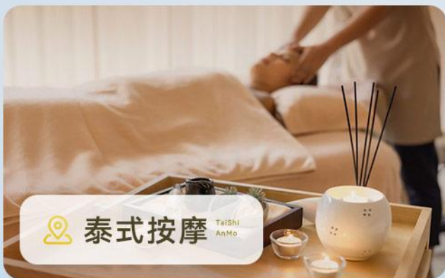
📍 泰式按摩 TaiShi AnMo