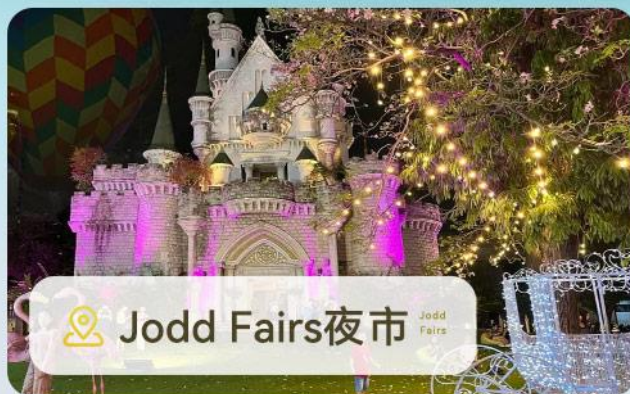
📍 Jodd Fairs夜市 Jodd Fairs