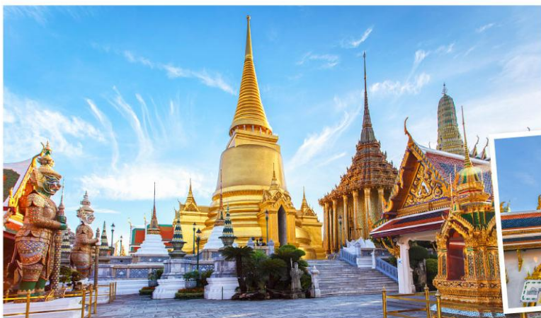
GRAND PALACE JADE BUDDHA TEMPLE 大皇宮（玉佛寺）