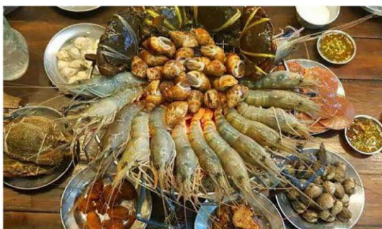
大头虾海鲜 BBQ 任吃