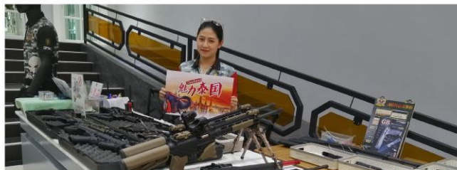
真枪打靶（每人5发子弹）