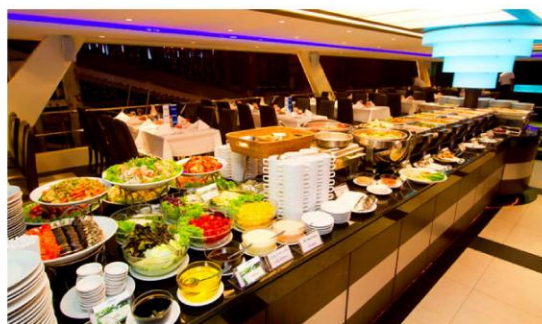
公主号游船自助餐