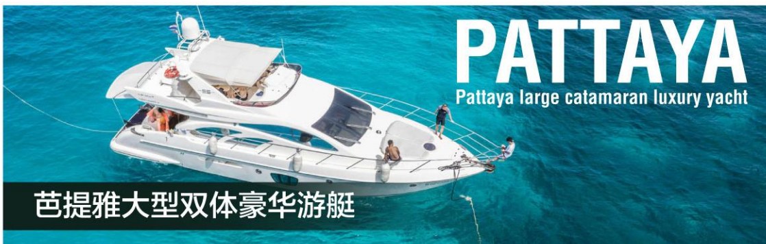
PATTAYA Pattaya large catamaran luxury yacht