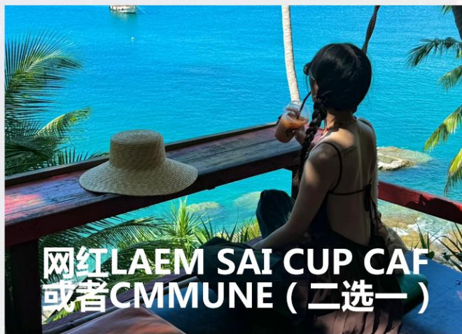
网红LAEM SAI CUP CAF 或者CMMUNE (二选一)