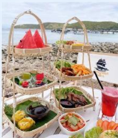
海滩特色竹篮下午茶 (主食+饮料+水果)