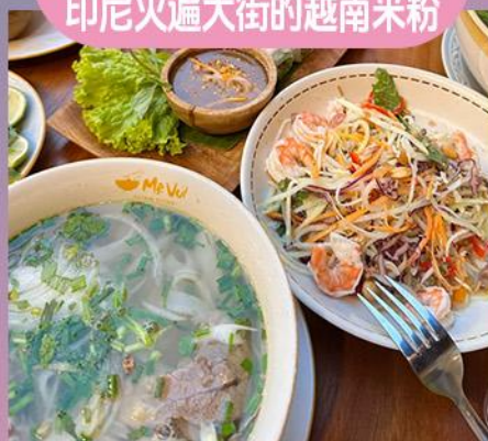
印尼火遍大街的越南米粉