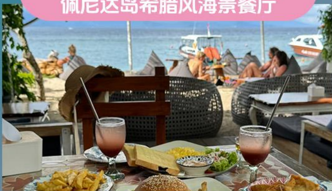
佩尼达岛希腊风海景餐厅