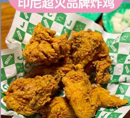
印尼超火品牌炸鸡