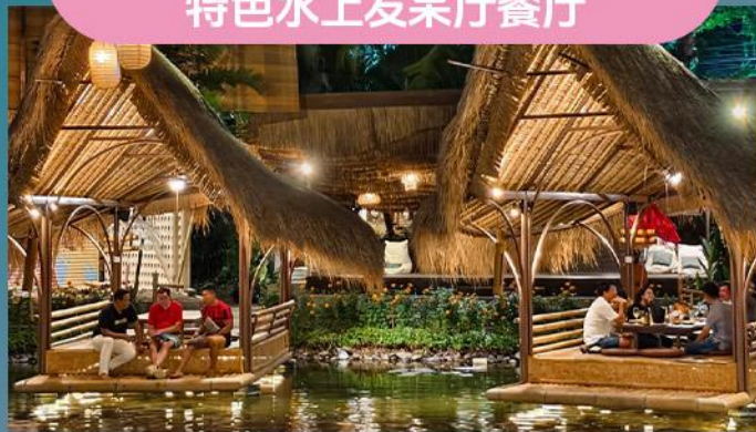
特色水上发呆厅餐厅