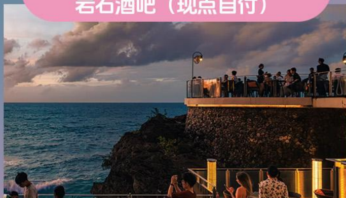
岩石酒吧（现点自付）