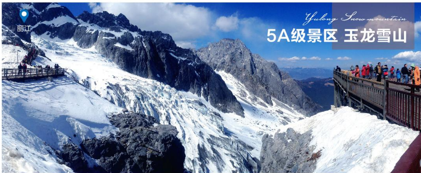
Yulong Snow mountain 5A级景区 玉龙雪山