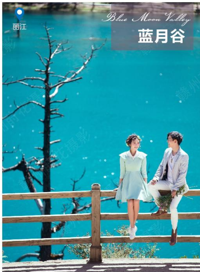
Blue Moon Valley 蓝月谷