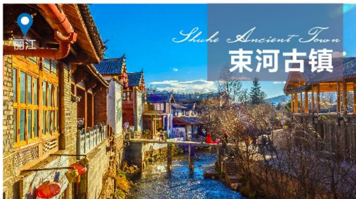
Shuhe Ancient Town 束河古镇