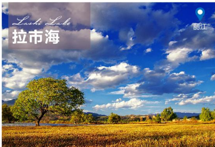
Lashi Lake 拉市海