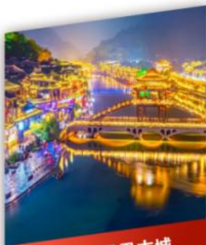
艳遇之都凤凰古城