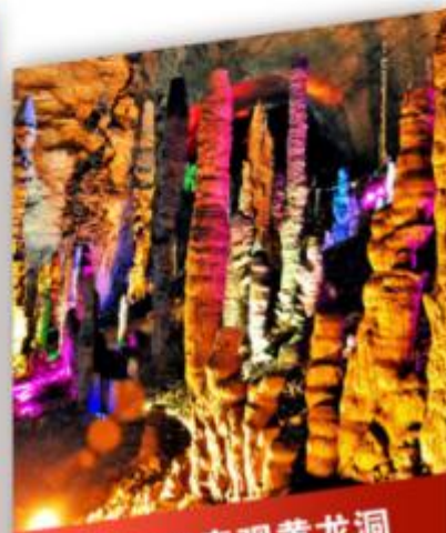
世界溶洞奇观黄龙洞