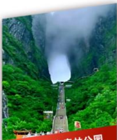
天门山国家森林公园

Changsha/Shao Shan/Zhangjiajie National Forest Park/Tianmen Mountain/Huanglong Cave (cruise ship) Tusi City/Fenghuang Ancient City (overnight stay)/Pure Play One Price All Inclusive Luxury Six Day Tour