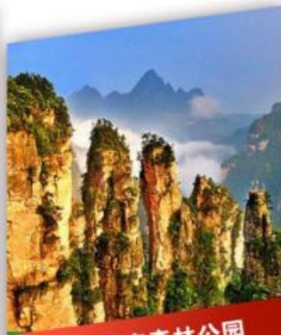
张家界国家森林公园