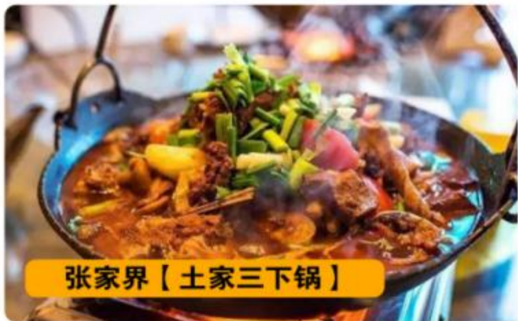
张家界【土家三下锅】