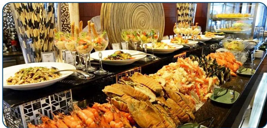
特色美食赠送 KINGPOWER国际自助餐