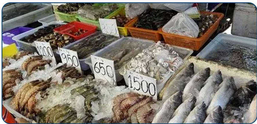
拉威海鲜市场 自由寻味大海美味