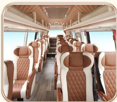
一排三座空间宽裕