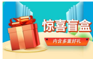
住：西安四星精品酒店