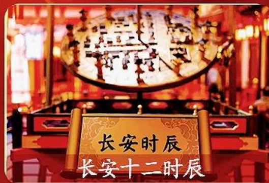
长安时辰 长安十二时辰