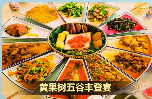
黄果树五谷丰登宴

贵州美食文化具有多样性和独特性 让人在品尝美食的同时 也能够感受到贵州的文化底蕴和历史渊源