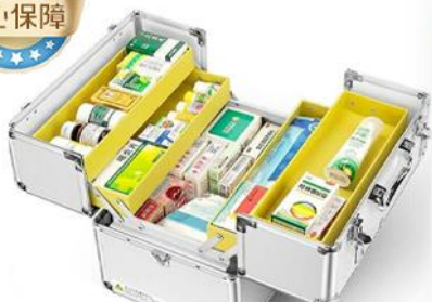
随车配备医疗百宝箱 (晕车贴、风油精、创可贴、碘伏、棉棒等) 为你出行保驾护航