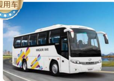
正规培训上岗师傅 正规上网旅游车