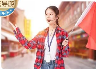
精选实力专线服务 型导游·深度讲解 边看边听