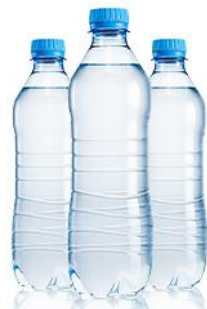
赠送每人每天 1瓶矿泉水