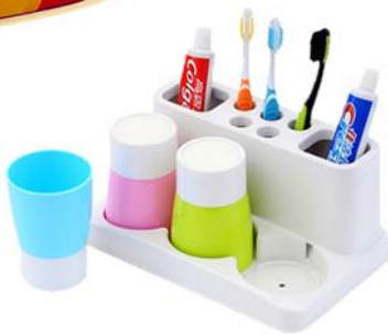
【酷爸俏妈】 定制洗漱用品