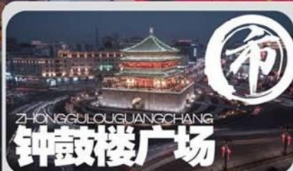
ZHONGGULOU GUANGCHANG 钟鼓楼广场

唐华清宫，是唐代封建帝王游幸的别宫。位于陕西省西安市临潼区。包括原骊山国家森林公园。