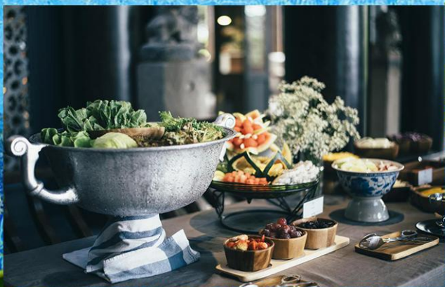
芭提雅参考酒店 Bay Beach Resort Pattaya