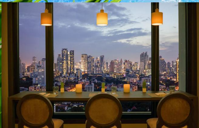
曼谷参考酒店 Avani Atrium Bangkok Hotel