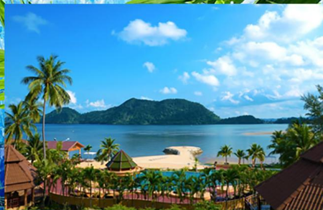
象岛参考酒店 The Aiyapura Koh Chang