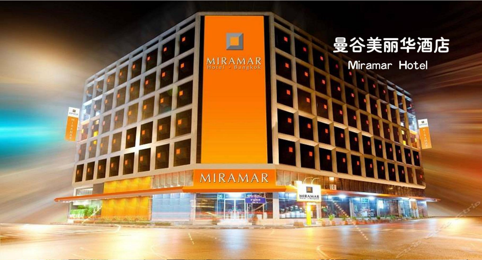
曼谷美丽华酒店 Miramar Hotel